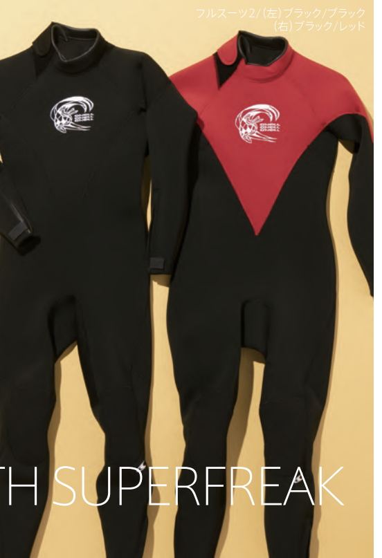
フルスーツ2/(左)ブラック/ブラック (右)ブラック/レッド

最新のテクノロジーを驚きのコストパフォーマンスで送り出す、 スーパーフリークシリーズ・フーズSC・スーパーライトシリーズ。 スタイルや用途にあわせて最適な開口デザインとタイプを選択 可能。既製サイズ、限定カラーの限定既製生産品。