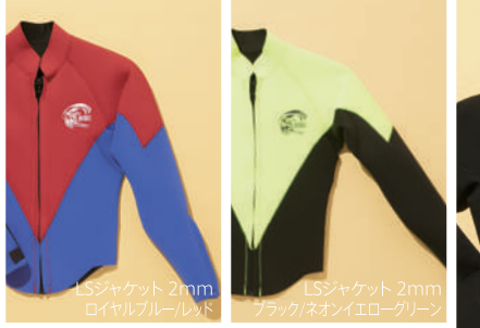
LSジャケット 2mm ロイヤルブルー/レッド