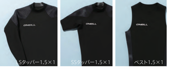
LSタイプ1.5×1 SSタイプ1.5×1 ベスト1.5×1