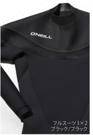
フルスーツ3×2 ブラック/ブラック