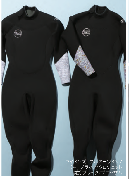
ウイメンズ:フルスーツ3×2 (左)ブラック/クロシェット (右)ブラック/ブロッサム