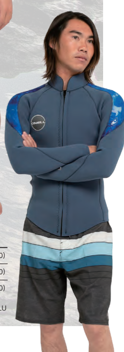
COLOR: GBL/DIZZY BLU/DIZZY BLU STITCH COLOR: SBL